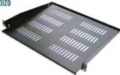
BANDEJAS FIJACIÓN FRONTAL VOLADIZO