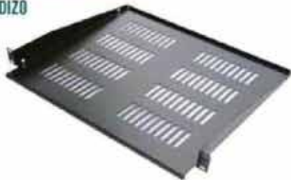
BANDEJAS FIJACIÓN FRONTAL VOLADIZO