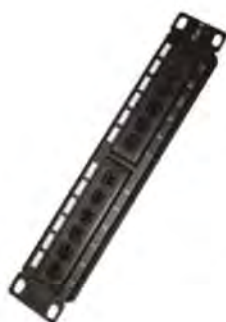
Patch panel 12 puertos cat.6 10" UTP