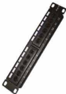
Patch panel 12 puertos cat.6 10" UTP